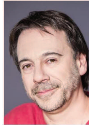
Michel Bussi.

Samedi 30 septembre, de 15 h 30 à 16 h 30 à la Tour de la Liberté,