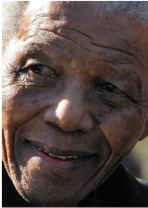
Nelson Mandela fera l'objet d'une expo photo.

Fresque réalisée par l'Adapei sur le thème « Animaux qui suivent ? »